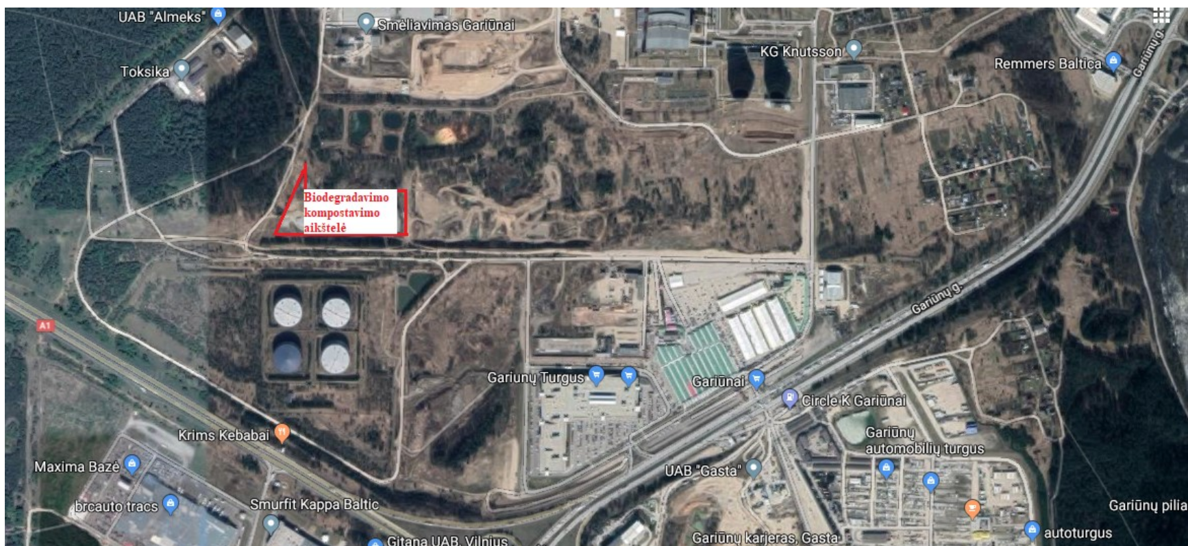
1 pav. Ūkinės veiklos objektas aplinkinių įmonių atžvilgiu