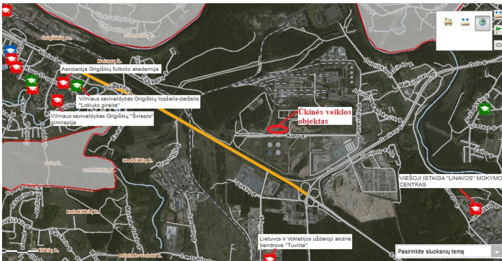
2 pav. Biodegradavimo – kompostavimo aikštelė švietimo (ugdymo) įstaigų atžvilgiu